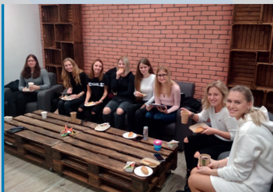
Erasmová snídaně je setkání bývalých a budoucích účastníků programu Erasmus+, při kterém si aktéři sdílejí zkušenosti z mezinárodních mobilit.