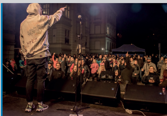
V říjnu 2019 proběhl již 6. ročník fakultního multižánrového festivalu FSEFest. Jeho součástí byla imatrikulace nových studentů, propagace programu Erasmus+ a představení činnosti Studentské unie UJEP. K vrcholům FSEFestu v roce 2019 patřily koncerty skupin TataBojs, či tradičních hostů Točilás, TopSpot a dalších.