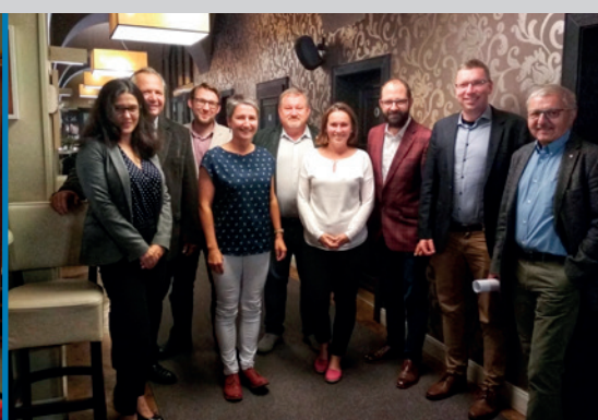
V září 2019 se zástupci fakulty setkali s řediteli partnerských středních škol, aby zhodnotili spolupráci v uplynulém období a domluvili se na základním rámci pokračování společných aktivit.