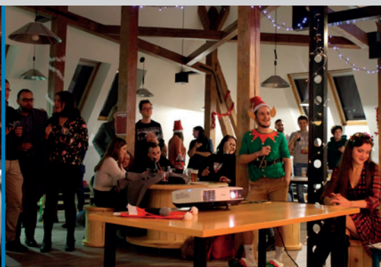
V rekonstruovaných prostorách VŠ klubu studenti zorganizovali Vánoční studentskou párty pro své kolegy i pracovníky fakulty.